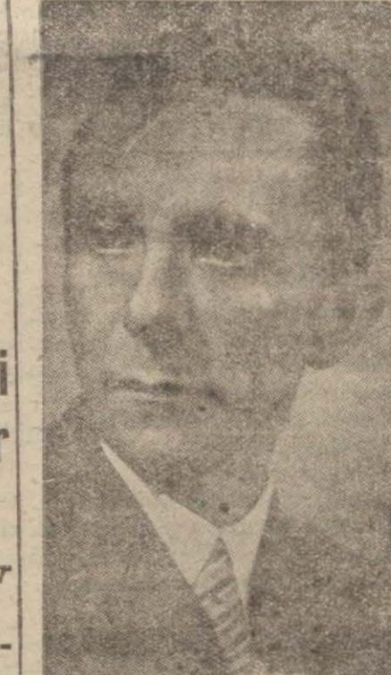
Dr. Göbbels (Yazısı 5 inci sayfada)

"İngiltereye lâyük olduğu cevabı verece- gimiz günün uzak olmadığı muhakkaktır,"