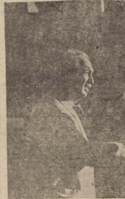
Berlin büyük elçimiz Saffet Arıkanın İstanbuldan hareketini ve Berline muvasalatını bildirmişti. Resmimiz büyük elçimiz Tempelhof hava meydanında Alman hariciyesi protokol şefi Von Daensberg tarafından karşılanışını göstermektedir.