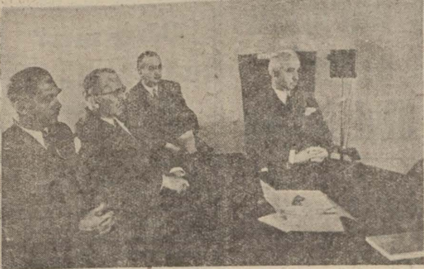
Ankara Foto muhabirimizin tayyare ile yolladığı resim: Millî Şef, Başvekil, Maarif Vekili ve Parti Genel Sekreteri ile birlikte dil kurultayında müzakereleri dinlerlerken