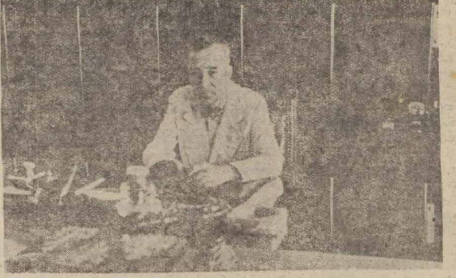
Ankara Foto muhabirimizin tayyare ile yolladığı resim: Yeni Hariciye Vekilimiz Numan Menemencioğlu makamında

Tayini yüksek tasdika iktiran eden yeni vekil dün vazifesine başladı